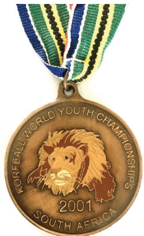
Bronz MS JAR (Pretorie) 2001