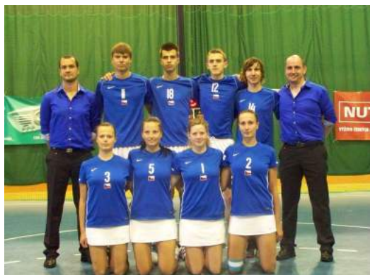
ME ČR (Olomouc) 2014