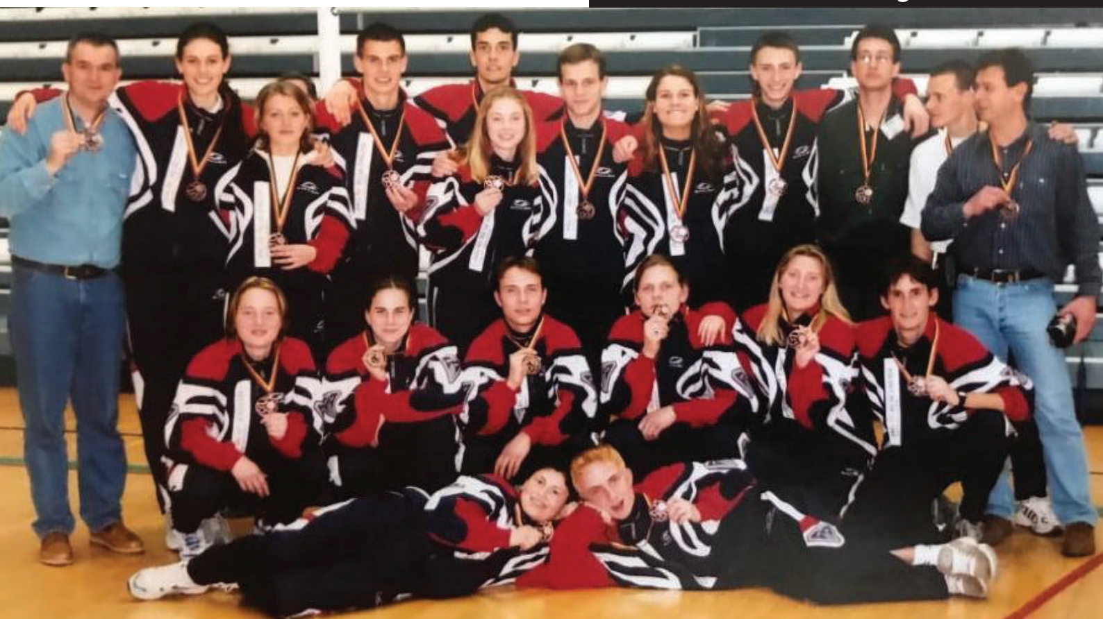
Bronzová radost ME Belgie (Gent) 2000

Devatenáctka dosáhla největšího úspěchu v roce 2001. Tehdy získal právo účasti na Světovém poháru mistr dorostenecké ligy, který doplnili vybraní hráči dalších družstev.